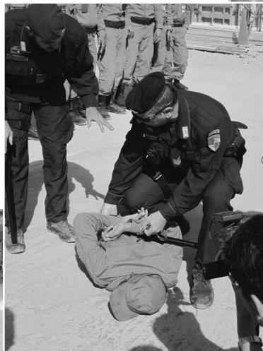
タリバンを捕まえる訓練