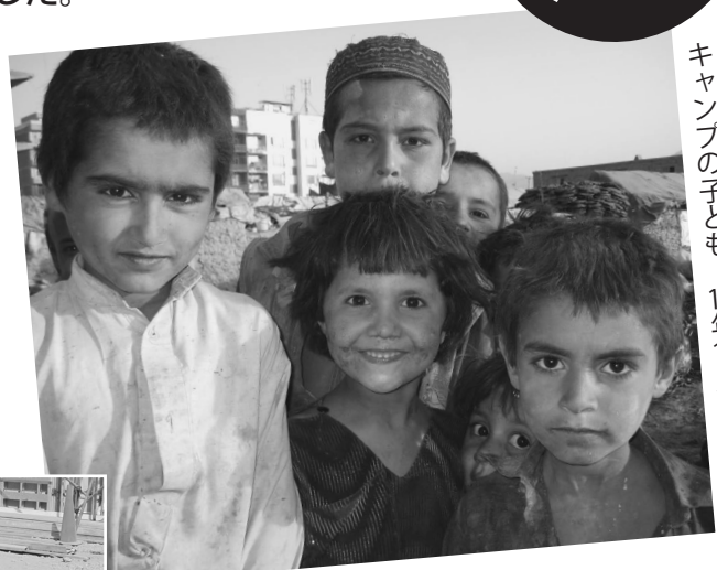
キャンプの子ども 10年10月撮影