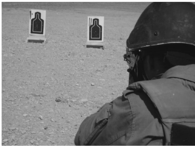
タリバンを撃ち殺す訓練