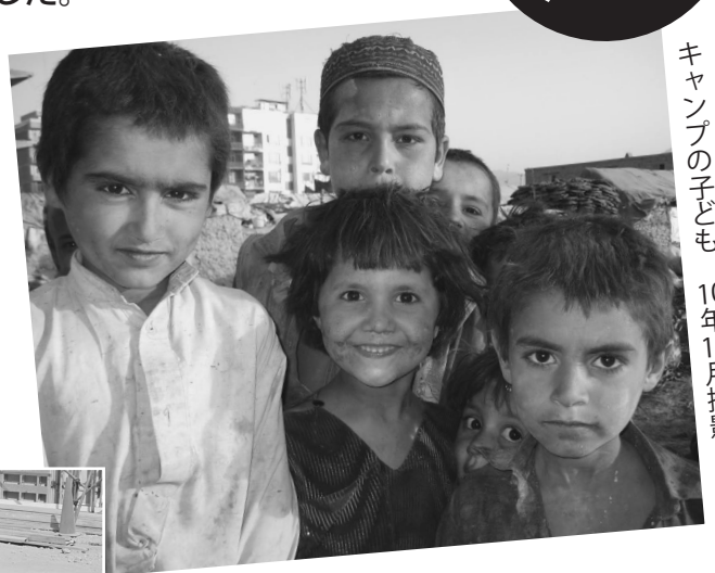
キャンプの子ども 10年10月撮影